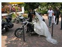
soyabohne □ Mitglied-

Registriert seit: 27.07.07 Ort: Pforzheim(Ba-Wü) Beiträge: 21