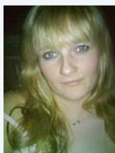
natalia23 □ Mitglied-

Registriert seit: 22.11.07 Ort: ISERLOHN Beiträge: 76